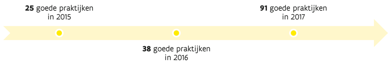
Figuur 2: aantal goede praktijken in 2015, 2016 en 2017

Tijdens een audit treffen auditoren regelmatig werkmethoden aan die inspiratie kunnen bieden voor andere organisaties. Wanneer deze werkmethoden een interne procedure bij Audit Vlaanderen doorstaan en goedgekeurd worden, zijn het goede praktijken. Bekijk hier alle goede praktijken.